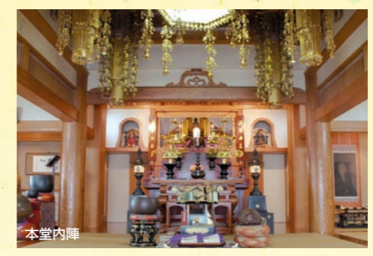
■宗慶寺墓地 概要 所在地:東京都台東区下谷2-14-5 宗派:曹洞宗 施設:本堂・客殿 駐車場完備

宗慶寺 寺歴 喜翁山宗慶寺は禅宗の曹洞宗に属し、本山は福井県の永平寺と神奈川県鶴見の總持寺です。分福茶釜で有名な茂林寺（群馬県館林市）の68末寺のひとつとして慶安2年（1649年）に創建。開山は快州正悦禅師、開基は喜翁宗慶様と伝えられていますが明らかではありません。山号寺号の由来は開基様のお戒名から。本尊には釈迦牟尼如来をお祀りし、また境内には十一面千手観音をお祀りしています。旧く江戸期より奉安しており、十一面千手観音は、病難除けに靈験新たか、近隣の信仰を集めています。創建以来の広々とした境内は、残念ながら、大正12年の関東大震災により山門を残し全焼。復興計画の一環による土地区画整理事業によって現在地に移転いたしました。亡き先々代の並々ならぬ労苦と檀信徒各位の方々のお力添えにより、昭和2年に本堂・庫裏・ 第一墓所が落慶。その後、幸いにも戦災による被害は免れましたが、老朽化も進み、昭和57年に新本堂が、平成10年に新書院・新庫裏を檀信徒の方々のご尽力により無事建立いたしました。さらには、書院裏手に第二墓所を拡張し、永代供養墓も建立。仏恩仏縁に感謝して、現在にいたっております。 合掌 当山36世竹原照雄